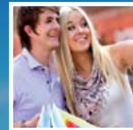
CLOSE TO LEISURE DESTINATIONS