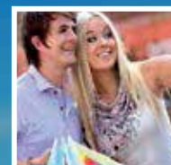
CLOSE TO LEISURE DESTINATIONS