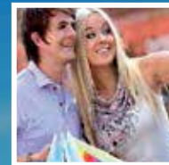
CLOSE TO LEISURE DESTINATIONS